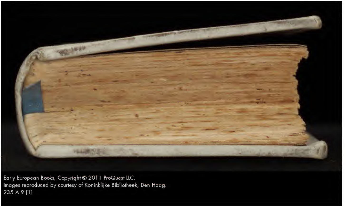
Early European Books, Copyright © 2011 ProQuest LLC. Images reproduced by courtesy of Koninklijke Bibliotheek, Den Haag. 235 A 9 [1]